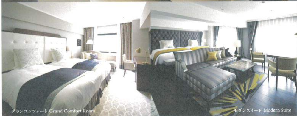
グランコンフォート Grand Comfort Room