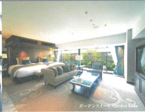
ガーデンスイート Garden Suite