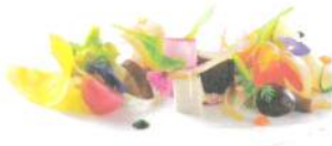
メインダイニング カサネ Main Dining casane

Enjoy a variety of menu items at our buffet open all day for breakfast, lunch, and dinner. A la carte and teatime menus are also available.