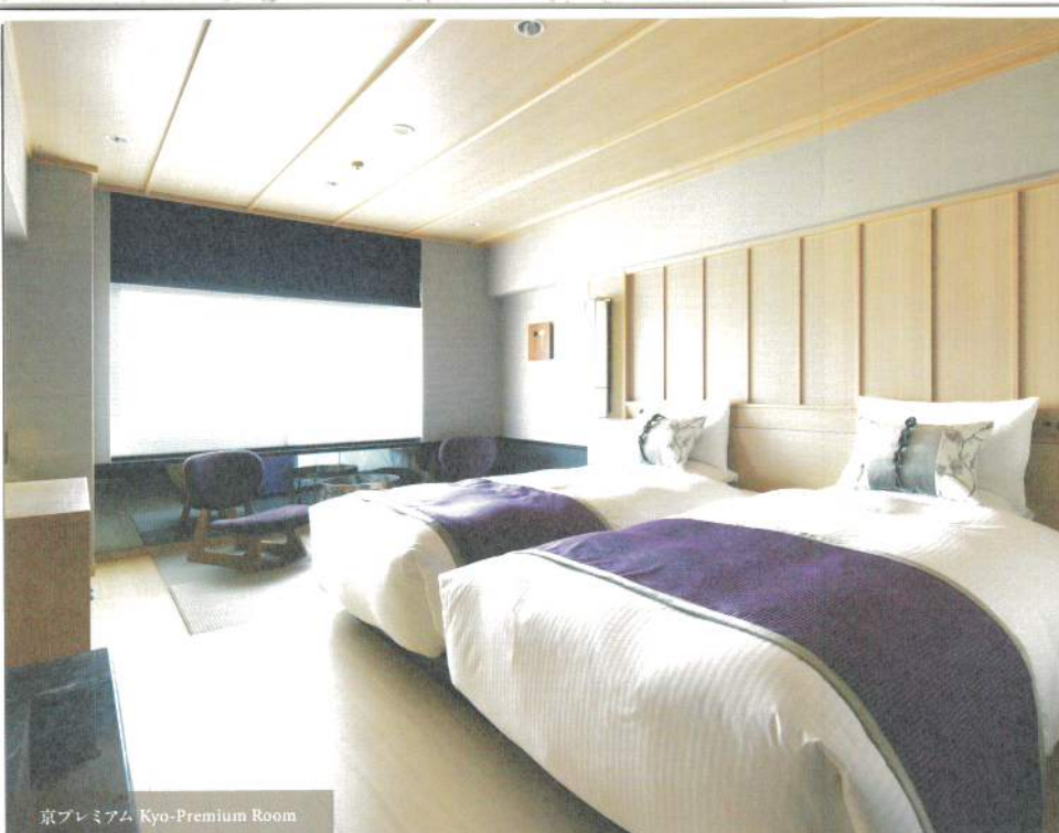
京プレミアム Kyo-Premium Room

Beds and bathrooms are designed for ultimate comfort, and amenities are high-quality yet earth-friendly. Find peace in the refinement of the calm and functional interior.