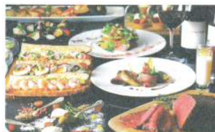
オールデイダイニング ラジヨウ All Day Dining La Jyho

多彩なメニューをビュッフェスタイルで朝昼夜と楽しめる、オールデイダイニング。ア・ラ・カルトや喫茶メニューもご用意。